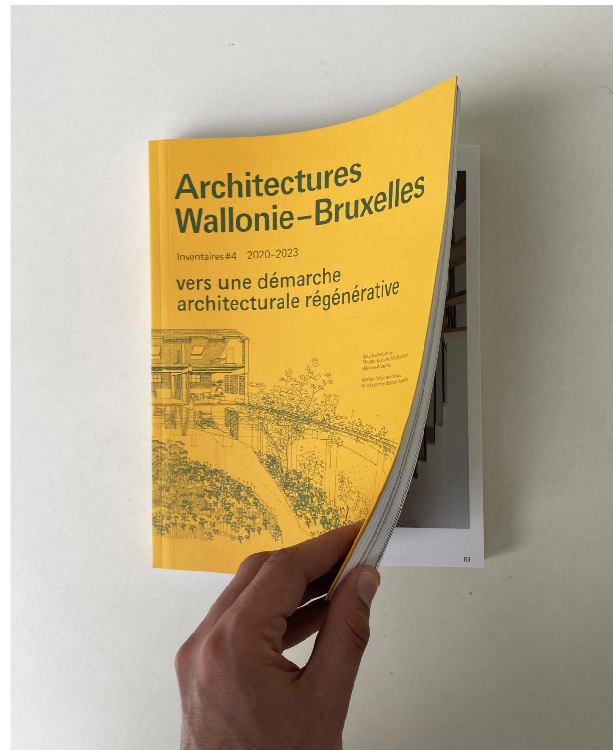
Ouvrage Architectures Wallonie-Bruxelles Inventaires #4 2020-2023