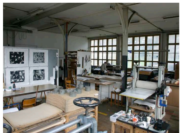
L'atelier de gravure, Moutier