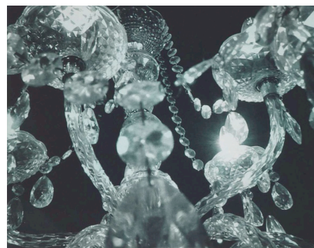
Pascal Danz , de la série Jellyfish , 2009 héliogravure en 2 couleurs, série de 5 estampes, 5 x (55 x 76.5 cm)