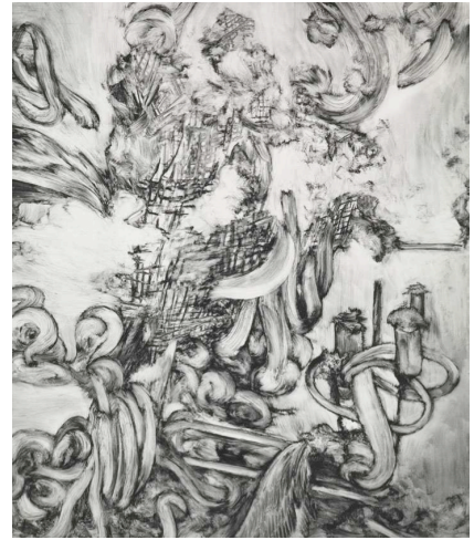
Julia Steiner, Rock (bird) , 2010 Héliogravure, 104 x 76 cm

Du 1 er au 5 juillet 2013 - Académie des Beaux-Arts, Charleroi Stage d'héliogravure animé par Arno Hassler / workshop pour imprimeurs professionnels en taille douce