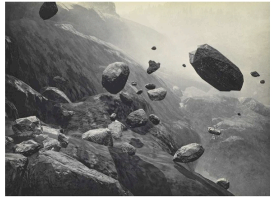
Monika Studer / Christoph van den Berg, Steinschlag (chute de pierres), 2007 héliogravure, aquarelle, en 2 couleurs, 64.5 x 78 cm, Ed. Verein für Originalgraphik, Zurich

Coopération culturelle entre la République et Canton du Jura et Wallonie-Bruxelles