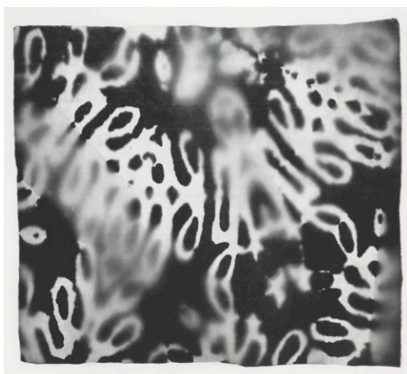
Max Matter , de la série Hell , 2008 8 héliogravures, 8 x (76 x 98 cm)

Valentine Reymond, conservatrice Musée jurassien des Arts, Moutier