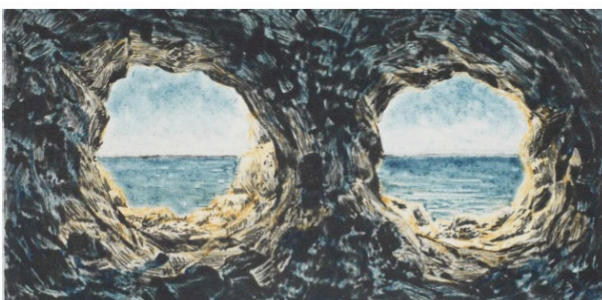
Markus Raetz, de la série Ombre , 2007 héliogravure en 1 ou 2 couleurs, pointe sèche, chine collé, coffret de 17 estampes, 17 x (37.5 x 30 cm)

Yves Hänggi chargé de projet d'échanges Jura - Wallonie-Bruxelles