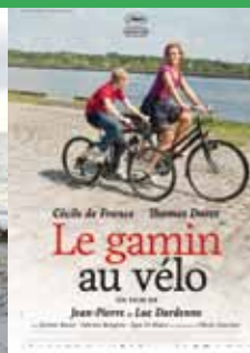
« Le gamin au vélo » de Jean-Pierre et Luc Dardenne