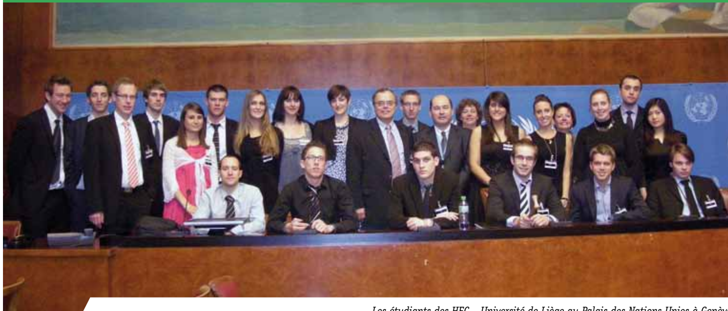
Les étudiants des HEC – Université de Liège au Palais des Nations Unies à Genève