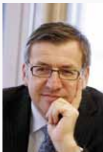
Steven Vanackere, Ministre belge des Affaires étrangères

L'Examen Périodique Universel (EPU) est un processus unique en son genre qui a débuté en 2008. Il consiste à passer en revue, tous les quatre ans, les réalisations de l'ensemble des 192 Etats membres de l'ONU dans le domaine des droits de l'Homme (48 Etats sont examinés par année lors de 3 sessions de l'EPU de 16 pays chacune).