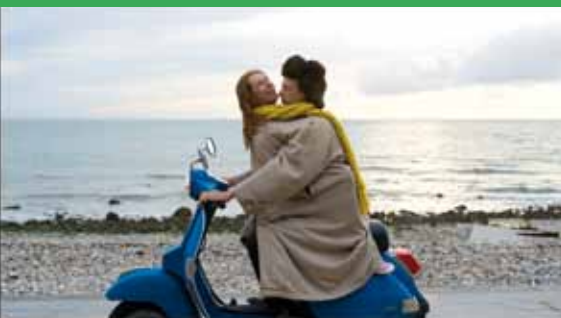
« La fée » de Dominique Abel, Fiona Gordon et Bruno Romy