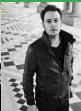
Coco Royal