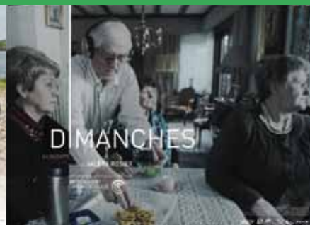
« Dimanches » de Valéry Rosier